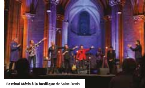
Festival Mérités à la basilique de Saint-Denis

En matière de tourisme, l'intérêt des événements est de contribuer à dynamiser une destination en renouvelant l'offre et en créant un sentiment d'urgence à la visite. Pour Plaine Commune, l'avantage est d'autant plus important qu'un événement attire spontanément des milliers de visiteurs dans nos villes, alors même que la difficulté au quotidien est de faire exister notre offre à côté de l'offre parisienne, pléthorique, et de convaincre le public de franchir le périphérique. En matière d'accueil d'événements, Plaine Commune dispose déjà d'une forte expérience. La coupe du monde de football en 1998 [qui fête ses 20 ans en 2018], les championnats d'athlétisme en 2003 et la coupe du monde de rugby en 2007, ont dynamisé le territoire et constitué de beaux moments de convivialité. L'Euro 2016 a été plus décevant, notamment en raison du « mur » érigé entre le Stade et son quartier, ce qui a fortement limité les retombées