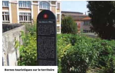
Bornes touristiques sur le territoire