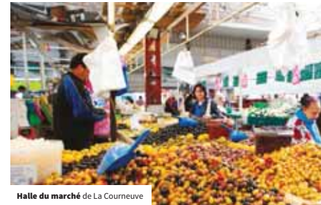
Halle du marché de La Courneuve

En ce qui concerne l'hébergement, l'objectif est d'accompagner le développement de l'offre d'un point de vue quantitatif et qualitatif, notamment en vue de répondre aux besoins liés à l'accueil des JOP 2024. On s'attachera à poursuivre la diversification de l'offre avec le développement d'hébergements moins standardisés et la création d'une auberge de jeunesse. On veillera également à renforcer l'ancrage local des acteurs (mise en relation avec des prestataires locaux) afin d'améliorer l'impact de la fréquentation touristique sur le développement local. Enfin, il s'agira d'encadrer le développement des plateformes dites collaboratives, telles que AirBnB, afin d'assurer une certaine équité avec les hébergements hôteliers (déclaration en mairie, collecte de la taxe de séjour) et de développer des partenariats pour valoriser les richesses du territoire via ces plateformes (action 11 : accompagner les hébergements touristiques existants et les projets de développement).