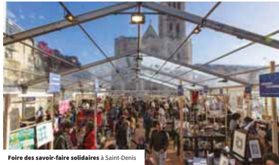
Foire de savoir-faire solidaires à Saint-Denis