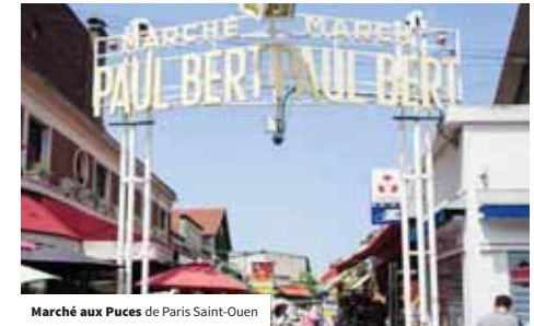
Marché aux Puces de Paris Saint-Ouen

En matière de restauration, il s'agit, en lien avec les services Commerces, d'accompagner la montée en gamme des établissements pour offrir des prestations d'un meilleur rapport qualité prix ainsi que de remédier, le cas échéant, à des carences de l'offre (à proximité de sites touristiques ou en lien avec des programmations ou événements culturels). À terme, on souhaiterait pouvoir développer une offre événementielle plus pérenne qui valorise les richesses de Plaine Commune en matière de « gastronomies du monde », en lien avec les marchés alimentaires du territoire : Saint-Denis, La Courneuve... (action 12 : accompagner le développement d'une offre de restauration qualitative et reflétant l'identité du territoire).