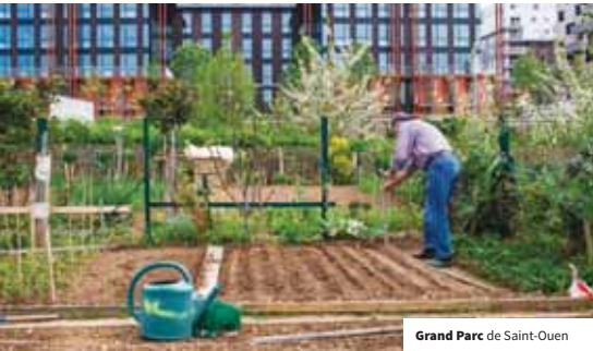
Grand Parc de Saint-Ouen