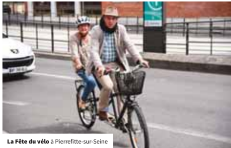
La Fête du vélo à Pierrefitte-sur-Seine