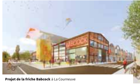
Projet de la friche Babcock à La Courneuve

On s'attachera également à renforcer la collaboration avec l'ensemble des services du département Développement et animation du territoire de Plaine Commune afin de mieux identifier les porteurs de projet dans le domaine du tourisme et de mieux les accompagner. En effet, l'évolution des attentes des touristes, l'essor des nouvelles technologies, le développement de l'économie dite collaborative entraînent l'apparition de nombreuses start-ups dans le secteur du tourisme. Dans ce travail d'accompagnement, une attention particulière sera portée aux acteurs de l'Économie Sociale et Solidaire ( action 15 : améliorer l'accompagnement des porteurs de projets dans les domaines du tourisme et du patrimoine ).