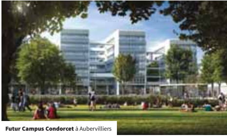
Futur Campus Condorcet à Aubervilliers