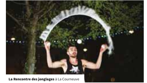
La Rencontre des jonglages à La Courneuve

locales et la participation des habitants. Cette tradition d'accueil va être confortée par les JOP 2024. Il s'agit de saisir cette opportunité pour donner à voir les richesses patrimoniales et culturelles ainsi que l'offre de services du territoire (hébergement, restaurants...) pour inciter les visiteurs à prolonger leur séjour et augmenter ainsi les retombées économiques locales. La qualité de l'accueil devra aussi les inciter à revenir ultérieurement ou à parler positivement de Plaine Commune à leurs proches. La préparation des JOP 2024 commence dès à présent et elle s'accroîtra dans le Schéma 2022/2027, avec le souci constant d'associer les habitants et les acteurs locaux aux festivités et de les faire bénéficier au mieux des retombées de l'événement.