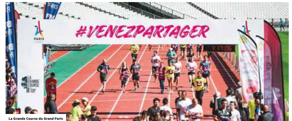
La Grande Course du Grand Paris

Le touriste se situe de base dans une forme d'insécurité et de vulnérabilité quand il voyage, dans la mesure où il se trouve loin de ses repères habituels (langue, culture, vie quotidienne...). Bien l'accueillir est une condition sine qua non pour le rassurer et lui permettre de profiter au mieux de son séjour. Bien reçu, un visiteur sera dans de bonnes conditions pour apprécier la visite ou la balade qu'il effectuera. Il sera incité à prolonger son temps de visite, à élargir le champ de sa découverte et à revenir l'approfondir ultérieurement. Il s'en fera l'écho positif auprès de sa famille, de ses amis ou des réseaux sociaux dont on connaît l'importance aujourd'hui... en positif, comme en négatif. Contribuer au développement d'un territoire accueillant pour