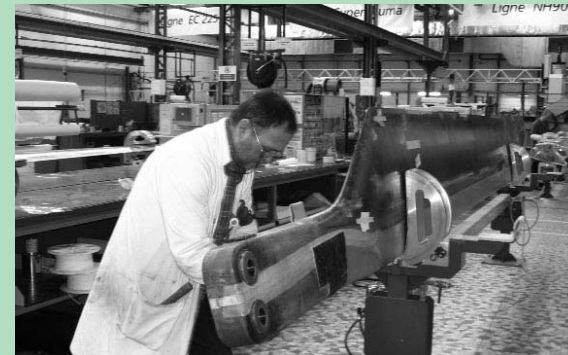
EUROCOPTER est une filiale du groupe EADS.

Dans l'aéronautique, les fusions successives, les groupements économiques et les intérêts d'État ont redistribué les cartes au début des années 90. Sur le front du site de La Courneuve, c'est le nom