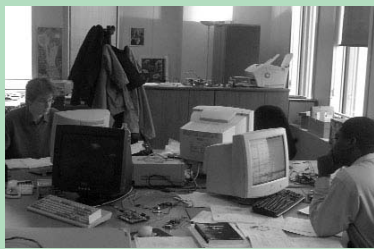
Depuis 7 ans, Créalie connaît une croissance de 15 à 30% annuels.