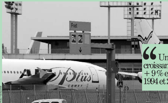
LA PLATE-FORME DU BOURGET accueille plus de 4 000 salariés.

Créé le 14 décembre 1923 sous le nom de « port aérien », l'aéroport du Bourget a été, à la veille de la seconde guerre mondiale le premier aéroport européen. Bien avant l'entrée en scène d'Orly en 1953, puis de Roissy dans les années 1970. Ce qui n'empêche pas ce terrain historique, qui a vu s'envoler Nungesser et Coli le 8 mai 1927 pour leur tentative de traversée de l'Atlantique, ou atterrir Lindbergh le 21 mai de la même année, d'être aujourd'hui le premier aéroport d'affaires en Europe. Seule la Grande-Bretagne, avec le terrain de Farnborough, près de Londres, propose un équipement semblable. Si jusqu'à ce début 2005, le territoire de Plaine Commune était relativement peu concerné par les activités aéronautiques, bien que des sociétés comme Delage Aero ou Messier Bugatti soient installées