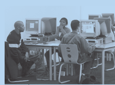
FRANÇAIS, MATHÉMATIQUES, INFORMATIQUE : ils ont choisi de reprendre des études, entre trois mois et un an selon leurs besoins.