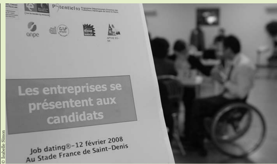
Jobdating du 12 février 2008 au Stade de France.

« Il s'agit d'un engagement partenarial très important, mais notre