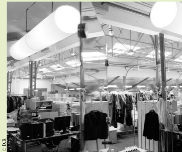
vente-privee.com. 15 000 m 2 clairs et beaux.

« En semaine, on a 100 000 clients en magasin dès sept heures du matin ! Et autant à 9 heures le week-end, quand commencent les ventes », se félicite Xavier Court, l'un des cofondateurs. Les « magasins » sont tout simplement le site Internet de vente-privee.com, où un clic vous donne accès aux trois ou quatre ventes de la journée. Ce site est le premier, en Europe, dédié à la vente privée : un million de visiteurs par jour. Vente-privee.com est né en 2001, quand le PDG Jacques-Antoine Granjon et ses six associés, qui fournissaient les grossistes de France et de Navarre en invendus, ont souhaité se diversifier. Ils ont opté pour un club privé haut de gamme sur le web. Faire partie des