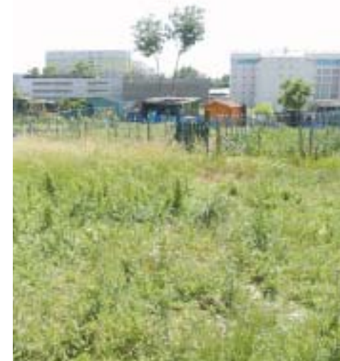
SI TOUT SE PASSE BIEN, c'est à côté de l'université Paris 8 que le nouveau siège pourrait être inauguré en 2008.

rédigée de la sorte. Mais cela est inutile, car après avoir étudié près de vingt sites, un seul reste en lice, celui des Tartres, au croisement de trois villes de l'agglomération: Pierrefitte, Saint-Denis et Stains. Et si tout se passe aussi bien que beaucoup de monde l'espère, en 2008 pourrait être inauguré le nouveau siège des Archives nationales. Sur environ 100 000 m 2 , seront alors hébergés les documents publics datant de 1789 jusqu'à