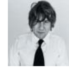
DE MANU CHAO À ARNO EN PASSANT PAR DUPAIN, six nuits de musique en fête proposées par le Festival de Saint-Denis. A ne pas manquer.