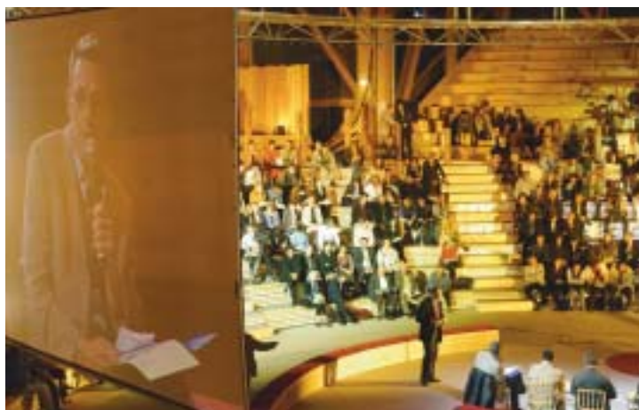
LES ASSISES DE PLAINE COMMUNE ont conforté la volonté de créer un conseil de développement.

L'initiative a été confirmée par les assises de Plaine Commune: un conseil de développement est en cours de constitution. Cet organe consultatif, indépendant du politique et de l'administratif, va réunir des habitants, des partenaires sociaux, des entrepreneurs et des associatifs des sept villes. Composé de 80 membres de la société civile, ce conseil veut être un lieu de réflexion collective qui alimente les décisions des élus communautaires. Durant la première année, il fonctionnera de manière expérimentale. Ce temps de rodage permettra d'adapter la forme et les modalités de son fonctionnement. Plaine Commune a lancé un appel à candidatures. Toute personne intéressée par ce nouvel outil de démocratie participative peut contacter la communauté d'agglomération.