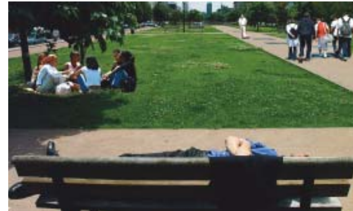
QUATRE HECTARES D'ESPACE PUBLIC, une succession de petits squares et d'aires de jeux.