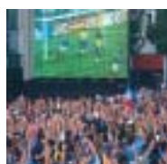
la grande scène des Nuits du Mondial.

devant sa télévision. Pour suivre les championnats du monde d'athlétisme, deux écrans géants seront mis à la disposition des publics, sur l'esplanade de l'écluse, près de