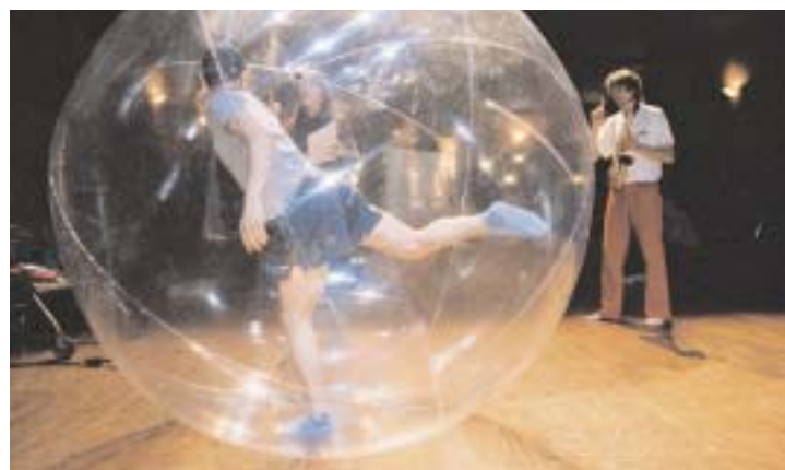
LE STUDIO THÉÂTRE DE STAINS échappe aux conventions en conjuguant art et social.

D u 9 au 31 juillet, il présente : « J'espérons que je m'en sortira », une adaptation d'un recueil de textes de Marcello D'Orta. Instituteur dans un faubourg de Naples, l'auteur restitue les paroles d'écoliers des quartiers populaires de Naples... et d'ailleurs. Le titre échappe aux règles de la syntaxe, tout comme le Studio Théâtre échappe aux conventions en conjuguant art et social.