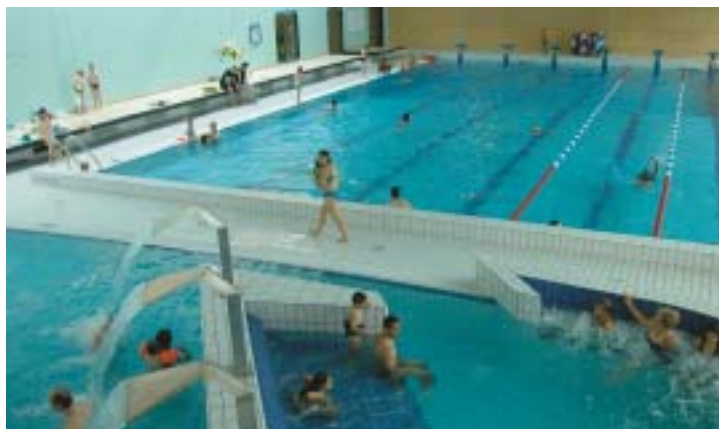
NUL DOUTE QUE LES HABITANTS feront de ce site un espace de sport et de loisirs.

la mission de délégataire de service public que lui a confiée la mairie d'Épinay-sur-Seine, en se basant sur l'importance et le rôle social des piscines de France dans chacune des communes où elles sont implantées. Pierre Legrand (1) Le mur ne sera ouvert au public qu'à la mi-août. CANYON, 8, rue Henri-Wallon 93800 Épinay-sur-Seine 01 49 71 54 64. Ouvert TLJ consulter l'accueil pour les horaires. www.epinay-sur-seine.fr et www.vert-marine.com