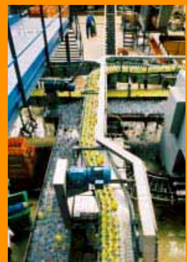
ORANGINA, un des fleurons économiques de la ville.

l'industrie n'en représente plus que 15 %. Actuellement trois secteurs se développent et recrutent: le transport logistique, le commerce de gros et le textile avec notamment l'arrivée du groupe Morgan. La ville travaille en synergie avec différentes structures comme l'École de la deuxième chance, la mission locale, l'ANPE pour tenter d'adapter l'offre à la demande. Avec Plaine Commune, le secteur économique devrait se renforcer et s'orienter vers l'accueil de PME et de PMI. D'importants projets comme l'installation des archives du ministère des Affaires étrangères donneront un nouvel élan. P.F.