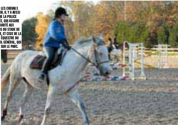
LE CENTRE UCPA DE LA COURNEUVE a été classé premier aux championnats de France des clubs.

OUTRE LES CHEVAUX DU CLUB, IL Y A AUSSI CEUX DE LA POLICE MONTÉE, QUI ASSURE LA SÉCURITÉ AUX ABORDS DU STADE DE FRANCE, ET CEUX DE LA GARDE ÉQUESTRE DU CONSEIL GÉNÉRAL, QUI VEILLE SUR LE PARC.