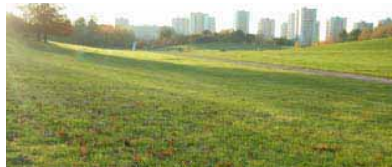
AU CŒUR DES VILLES, renards roux, lapins de garenne, fouines et belettes jouent à cache-cache avec les citadins.

Le parc départemental, à cheval sur plusieurs communes, s'étend sur 350 hectares. Créé sur d'anciennes terres maraîchères, il offre un site de promenade au relief exceptionnel. Autour des lacs, une flore dense d'arbres, de fleurs et d'arbustes est devenue au fil des ans un refuge pour une multitude d'oiseaux, d'insectes et de petits mammifères. Le parc abrite 140 espèces d'oiseaux. À la tombée de la nuit, hiboux et rapaces nocturnes investissent les lieux. Un paradis pour les ornithologues qui peuvent observer des espèces rares comme le bongion nain, le plus petit des hérons. Un havre de verdure au cœur des villes, où renards roux, lapins de garenne, fouines et belettes jouent à cache-cache avec les citadins. À pied, à vélo, en toute saison, le parc accueille de nombreux visiteurs. Pour les moins courageux ou pour ceux qui veulent retrouver les ambiances d'autrefois, d'avril à octobre, les samedis et dimanches, l'omnibus du parc, un attelage tiré par trois chevaux harnachés de front, arpente les allées. Il longe le lac, permet d'admirer roseraie et vallée des fleurs. Une traversée qui se termine au centre équestre. P.F.