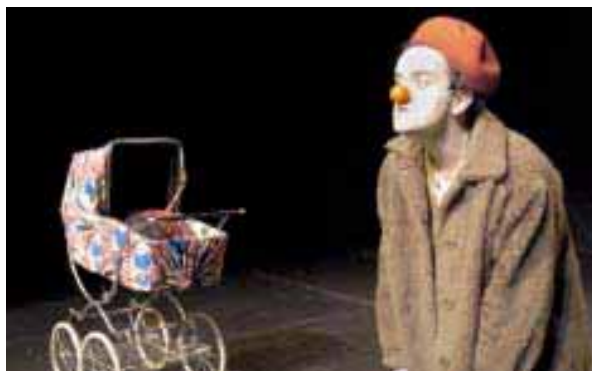
UNE SUCCESSION DE SPECTACLES ET DE RÉPÉTITIONS, comme ici lors du filage de Fantasio.