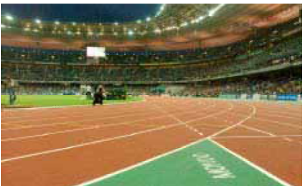
LA GRAND-MESSE A DÉJÀ SA CATHÉDRALE. Après les Jeux, les nouveaux sites seraient conservés.

C'EST UNE ÉPREUVE À OBSTACLES. PARIS, AU COUDE À COUDE AVEC MADRID, S'IMPOSERA-T-IL DANS LA DERNIÈRE LIGNE DROITE ? PLAINE COMMUNE, QUI BÉNÉFICIERAIT AU PREMIER CHEF DE SA VICTOIRE, L'ENCOURAGE.