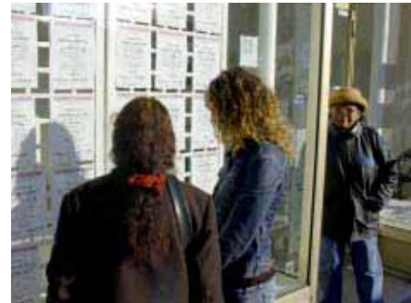
L'OFFRE NE PEUT répondre à l'ampleur de la demande, ce qui génère une montée des prix.

Un vent de folie a soufflé les 9 et 10 octobre sur Stains, quand le groupe Nexity-Apollonia a débuté la commercialisation de 150 des 300 logements prévus dans le quartier Renelle. 3 000 personnes s'y sont précipitées. À 140 000 euros le 3-pièces et 170 000 euros le 4-pièces, les appartements sont partis comme des petits pains. Qui sont ces candidats acquéreurs dopés par des taux de crédit attractifs et le léger rebond de croissance en 2004? Un mélange de jeunes couples primo-accédants et de propriétaires. D'où viennent-ils? Environ la moitié habite la ville où ils prospectent. 25 % arrivent des communes limitrophes et 25 % de Paris. Pourquoi cherchent-ils