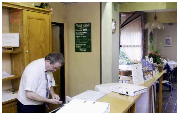
AVEC 1,1 MILLION DE NUITÉES, le secteur hôtelier se porte mieux ici que dans le reste du 93.

Il n'y a pas si longtemps, dans cette partie de la Seine-Saint-Denis, en guise d'hôtels, il n'y avait que des meublés. Aujourd'hui, le paysage change avec l'émergence d'une véritable hôtellerie. Signe de l'attractivité d'un territoire, garant de retombées économiques, ce phénomène est suivi avec attention par les élus et les services de l'agglo. Une étude vient d'être réalisée sur les perspectives qu'offrait cet essor. Réalisée sur un périmètre élargi à Pantin et à Saint-Ouen pour tenir compte d'une dynamique à l'œuvre sur l'ensemble du bassin, ce travail est riche d'enseignements.