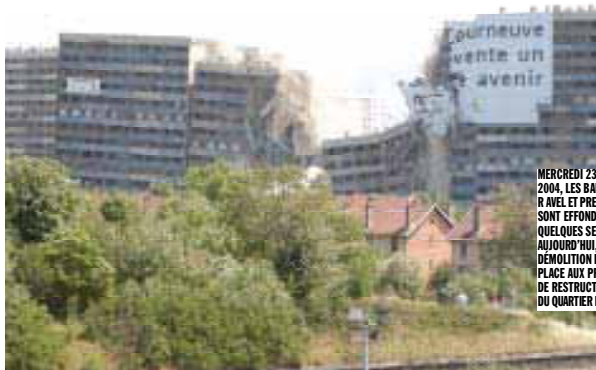
MERCREDI 23 JUIN 2004. LES BARRES RAVEL ET PRESOV SE SONT EFFONDREES EN QUELQUES SECONDES. AUJOURD'HUI, CETTE DEMOLITION LAISSE PLACE AUX PROJETS DE RESTRUCTURATION DU QUARTIER DES CLOS.

L'arrivée dans l'agglomération a été longuement préparée: des groupes de travail composés d'élus, de techniciens et de professionnels se sont réunis régulièrement pour que, dès son entrée effective, La Courneuve soit dans la même dynamique que les sept autres villes, avec la mise en réseau des bibliothèques, la collecte sélective des déchets ménagers, l'aménagement... Pascal Fraysse