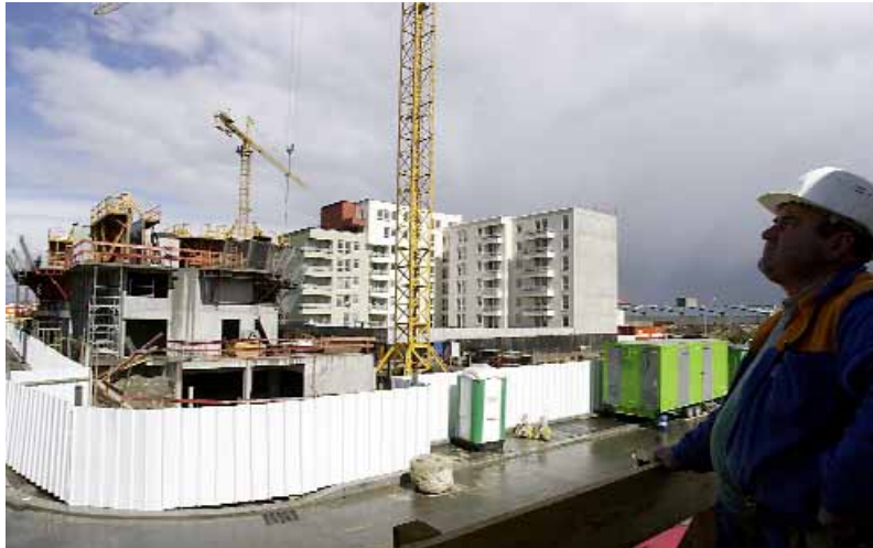
SUR LE PLAN LOCAL DE L'HABITAT, le conseil a insisté sur la notion d'environnement de qualité.

C'est l'histoire d'une expérience de démocratie participative. Comment permettre à la société civile de s'exprimer sur les orientations prises par Plaine Commune? Une équation pas si simple. S'agissant d'une ville, l'échange entre élus et population se fait, naturellement, sur le terrain de la proximité: vie associative, permanences, conseils de quartier, etc. À l'échelle de l'agglomération, il fallait inventer autre chose. Dans la charte de fonctionnement de Plaine Commune, le texte référence des élus communautaires, une volonté était affichée: « Nous inscrivons notre projet dans les principes d'une démocratie ouverte à tous et portant sur des enjeux élargis. » Un paragraphe entier étant consacré à la mise sur pied d'un conseil de développement « où seraient représentés les acteurs de la vie sociale et du développement de chacune des villes ». Un conseil qui aurait « un rôle consultatif pour toutes les décisions communautaires qui concernent le développement du territoire, son aménagement, et son devenir en matière de bien social et de solidarité ». De la théorie à la pratique, c'est au début 2004 que