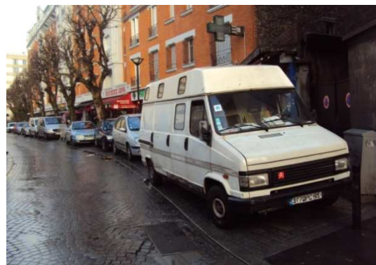
Rue Ernest Prevost, Aubervilliers

« La rue Chouveroux est très empruntée pour rejoindre le groupe scolaire, le stade... et bientôt le collège. Or, les trottoirs sont étroits et souvent encombrés par des véhicules stationnés sur les bateaux. »