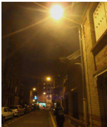
Rue de l'Union, Saint-Ouen

Le Plan de prévention du bruit dans l'environnement (PPBE) définit les actions pour limiter l'exposition de la population au bruit : isolation phonique des bâtiments, murs anti bruit, enrobés acoustiques, limitation du trafic aérien la nuit, sans oublier le développement des alternatives à la voiture individuelle.