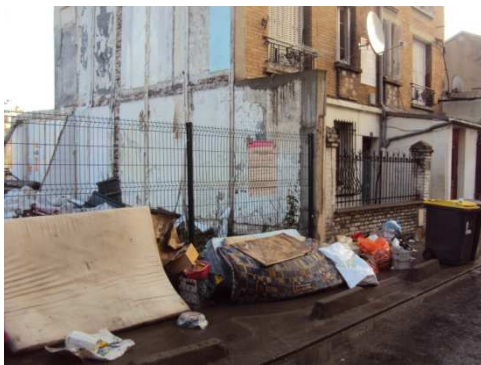
Rue Bordier, Aubervilliers

Les dépôts sauvages encombrant les trottoirs et ne donnent pas envie de marcher.