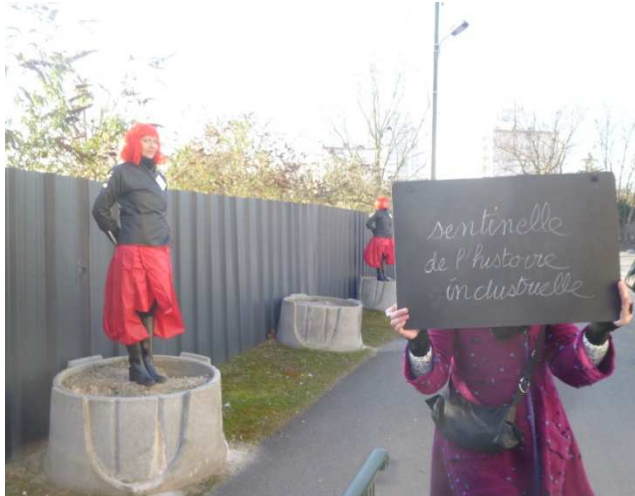
Balade « Sur les pas du TEN », d'Épinay à Villetaneuse

La multiplication des grilles et des palissades opaques donne parfois une impression d'enfermement et de claustrophobie.