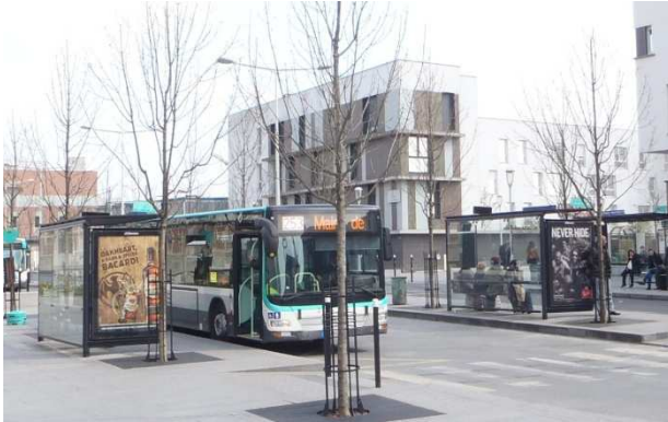
Gare RER La Courneuve-Aubervilliers