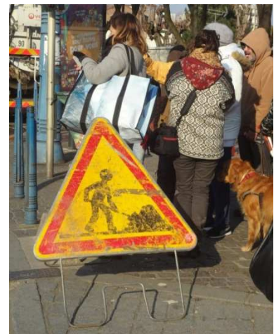
Rue de Strasbourg, Saint-Denis

« Cet échafaudage bloque l'accès au trottoir, il oblige les poussettes et fauteuils roulants à marcher sur la chaussée ! »