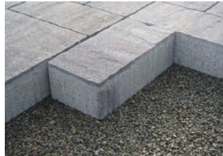
Exemple de pavés autobloquants