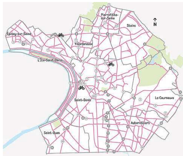
Le réseau cyclable à terme

Chaque année, Plaine Commune réalise de nouveaux itinéraires cyclables dans le cadre de son Plan vélo.