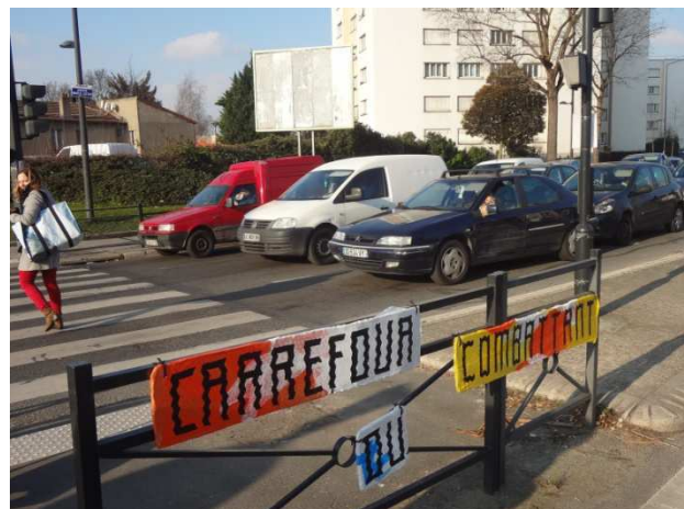
Carrefour Lamaze, Saint-Denis

« Au carrefour du boulevard Jean Jaurès et de la rue Albert Dhalenne, le temps de vert piéton permet tout juste à un marcheur rapide de traverser. »