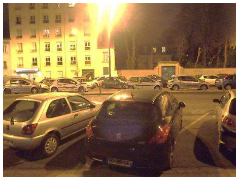
Rue Albert Dhalenne, Saint-Ouen

« Il faudrait redonner au piéton la place dont il a besoin ! »