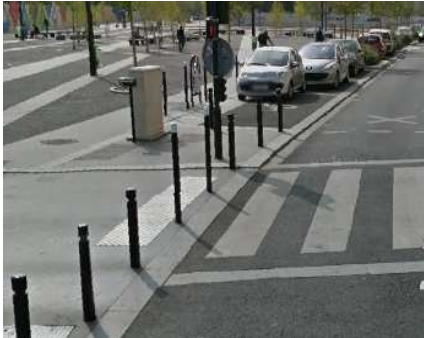
Parvis Ouest de la gare de Saint-Denis

Dans le cadre de son Plan de mise en accessibilité de la voirie (PAVE), Plaine Commune réalise chaque année des travaux de mise en accessibilité , en plus des opérations d'aménagement. La plupart des arrêts de bus sont aujourd'hui accessibles aux personnes à mobilité réduite.