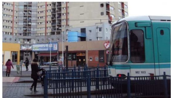
Station Hôtel de Ville de La Courneuve du T1

« Un jour dans le tramway, j'ai vu un homme voler un téléphone, je lui ai fait une remarque et il m'a frappé. »