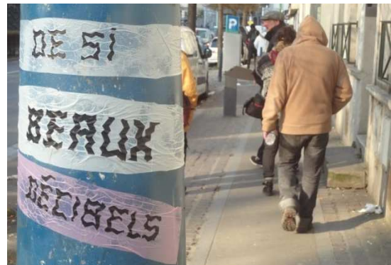
Rue de Strasbourg, Saint-Denis

« Si l'on veut que les gens se déplacent à pied, il faut qu'ils puissent discuter entre eux, donc s'entendre. »