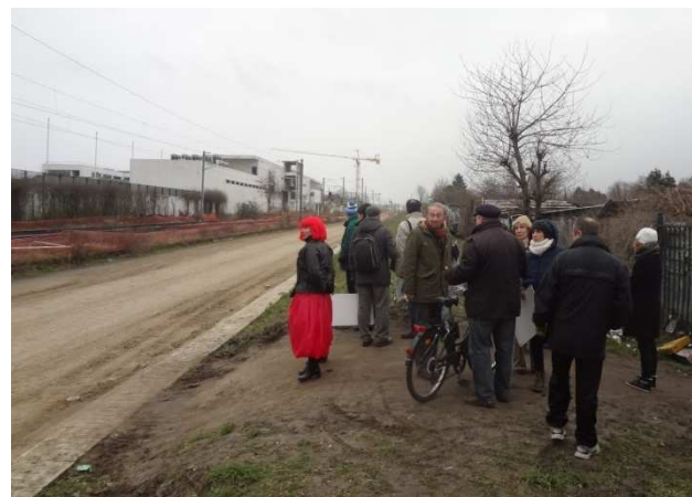
Traversée des voies du Tram Express Nord, Stains

De nombreux raccourcis sont empruntés par les piétons, plus ou moins adaptés, parfois à travers des lieux en chantier. D'autres raccourcis seraient à créer.