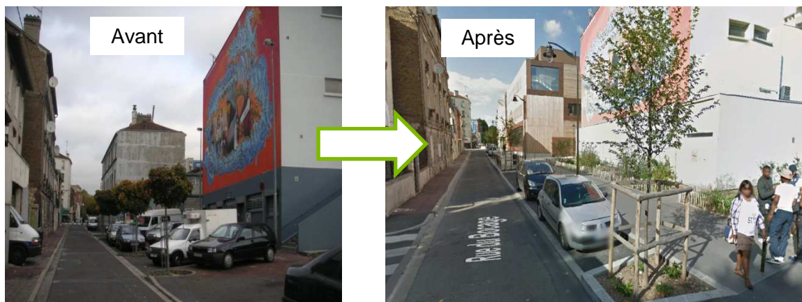
Rue du Bocage, L'Île-Saint-Denis

Le vélo est toujours pris en compte, soit par des aménagements dédiés (piste ou bande cyclable, couloir bus-vélo), soit à travers des espaces partagés (zone 30, zone de rencontre, aire piétonne). De même, les espaces publics créés ou requalifiés sont systématiquement accessibles aux personnes à mobilité réduite.