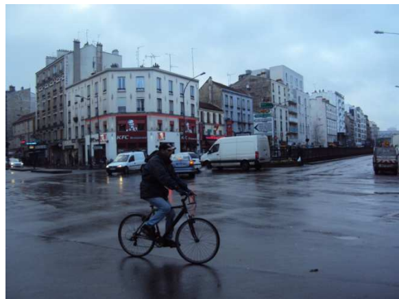
Carrefour Aubervilliers-Pantin Quatre Chemins

Lors de la balade à Aubervilliers : « J'évite d'emprunter les Quatre Chemins en vélo, je préfère rejoindre la Porte de la Villette par d'autres voies moins fréquentées. »