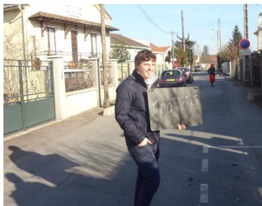
« Trottoir ? » s'interroge un participant

Lors de la réunion publique d'ouverture :