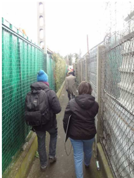
Sentier de la Planchette, vers la gare du RER D Pierrefitte-Stains

De nombreux raccourcis sont empruntés par les piétons, plus ou moins adaptés, parfois à travers des lieux en chantier. D'autres raccourcis seraient à créer.